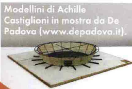
Modellini di Achille Castiglioni in mostra da De Padova ( www.depadova.it ).