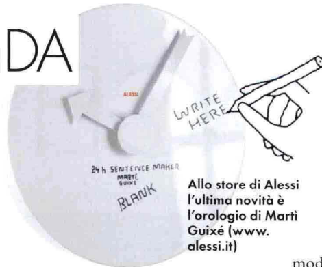
Allo store di Alessi l'ultima novità è l'orologio di Martí Guixé ( www.alessi.it )