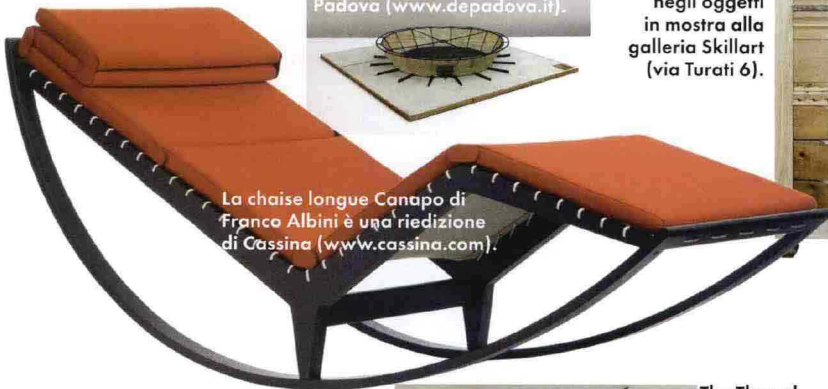
La chaise longue Canapo di Franco Albini è una riedizione di Cassina ( www.cassina.com ).