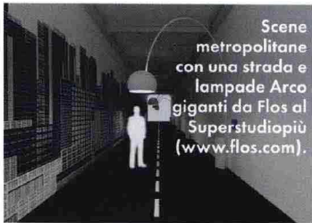
Scene metropolitane con una strada e lampade Arco giganti da Flos al Superstudiopiù ( www.flos.com ).