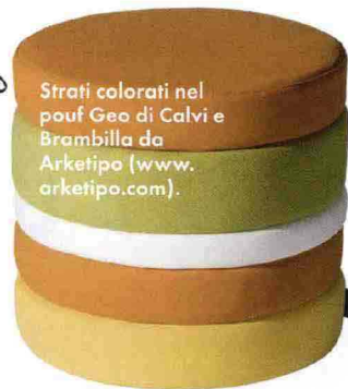
Strati colorati nel pouf Geo di Calvi e Brambilla da Arketipo ( www.arketipo.com ).