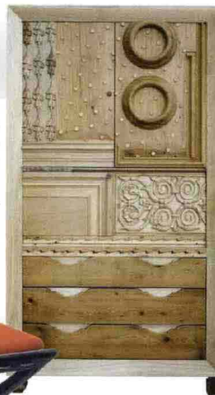
Toshiyuki Kita ci guida nella casa del futuro. A chi insegue le novità dell'universo casa non può sfuggire l'estro e la creatività di architetti che trasformano il pouf in un maxi dolcetto (il Geo di Calvi e Brambilla) e la sperimentazione dei fratelli Campana con i loro innovativi e indistruttibili

vasi di resina. Anche il vecchio anonimo orologio a cucù cambia veste e diventa un'opera d'arte: come quello scarabocchiato di Martí Guixé per Alessi. Volete veramente emozionarvi? Il Fuorisalone è anche una gara a chi crea l'allestimento più scenografico: come quello di Frette in via Sant'Andrea tra cuscini che piovono dal cielo e montagne di mobili e oggetti che sfidano la gravità.