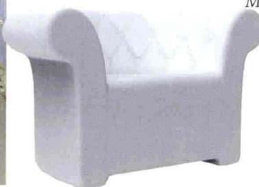
Poltrona matelassé da esterno: è la novità per un living open air di Serralunga ( www.serralunga.com ).